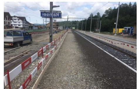
Bahnhof Ramsei im Juni 2017

Der BLS Kundendienst ist täglich zwischen 7.00 und 19.00 Uhr für Sie da. Sie erreichen uns unter: +41 (0)58 327 31 32 oder über unser Kontaktformular auf bfs.ch/kundendienst